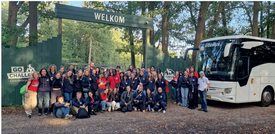
Groepsfoto voor de poort van het outdoorterrein Woodland van Summercamp Heino

Zes dagen per week krijgen ze les van hun begeleiders of (online) van hun professoren. Het zijn niet alleen maar lessen 'binnen de schotten van het schip', want juist het ervaren leren staat centraal. Of het nu aan land, op zee of in een aanleghaven is, leren doen ze in de praktijk. Ze verdiepen zich bijvoorbeeld in de (kunst)geschiedenis van Europa of bestuderen de mariene biologie terwijl ze over de wereldzeeën zeilen.