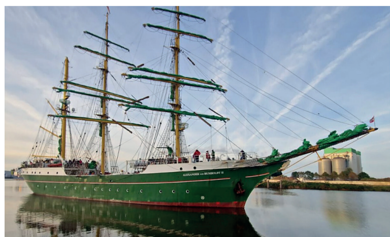
Alexander von Humboldt II 'ALEX-2'

De studenten, tieners tussen de 16 en 19 jaar oud, volgen een zeilopleidingsprogramma op het schip 'Alexander von Humboldt II' (ALEX-2). De ALEX-2 zien ze pas in Bremerhaven (Duitsland), waar het echte zeilavontuur begint. Onder leiding van een kapitein en 22 bemanningsleden leren ze alles over het zeilen op zo'n 'huge' schip. Ze worden onderdeel van de bemanning en hebben dagelijks twee uur dag-én twee uur nachtwacht aan dek. Daarnaast volgen ze een studieprogramma.